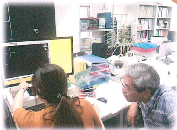
↑CADを教わるハナちゃん

●SITEKIの会社の雰囲気はどうですか? 会社のみんなは優しいですか? ↓はい、皆さんとても優しいです。初めて海外で働いたので、日本の習慣やマナー等が全然わからずとても心配でした。 この会社に入社して、皆さんとても親切で仕事のことだけでなく日本語や日本のマナーを教えてくださいます。 いつも教えてくださいましてありがとうございます。